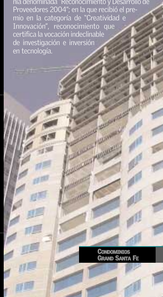
CONDOMINIOS GRAND SANTA FE