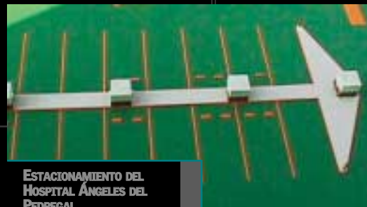
ESTACIONAMIENTO DEL HOSPITAL ÁNGELES DEL PEDREGAL

EUCO forma parte del consorcio RPM, que agrupa a casi 40 empresas más, entre las que se encuentran Tremco, Stonhard, Carboline, Fibergrate, American Emulsions, Rust Oleum, Dap, Bondex y Mohawk. De igual forma, el Centro de Investigación y Desarrollo del grupo se ha convertido en el punto de partida de varias de las obras más importantes de las últimas décadas alrededor del mundo.