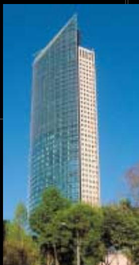
HELIPUERTO Y CUARTO DE MÁQUINAS DE LA TORRE MAYOR