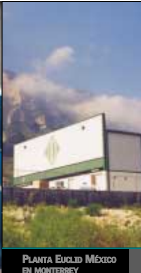
PLANTA EUCLID MÉXICO EN MONTERREY